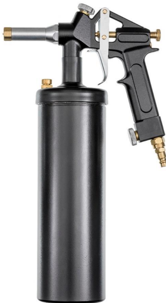
Abbildung zeigt 3000 FGR